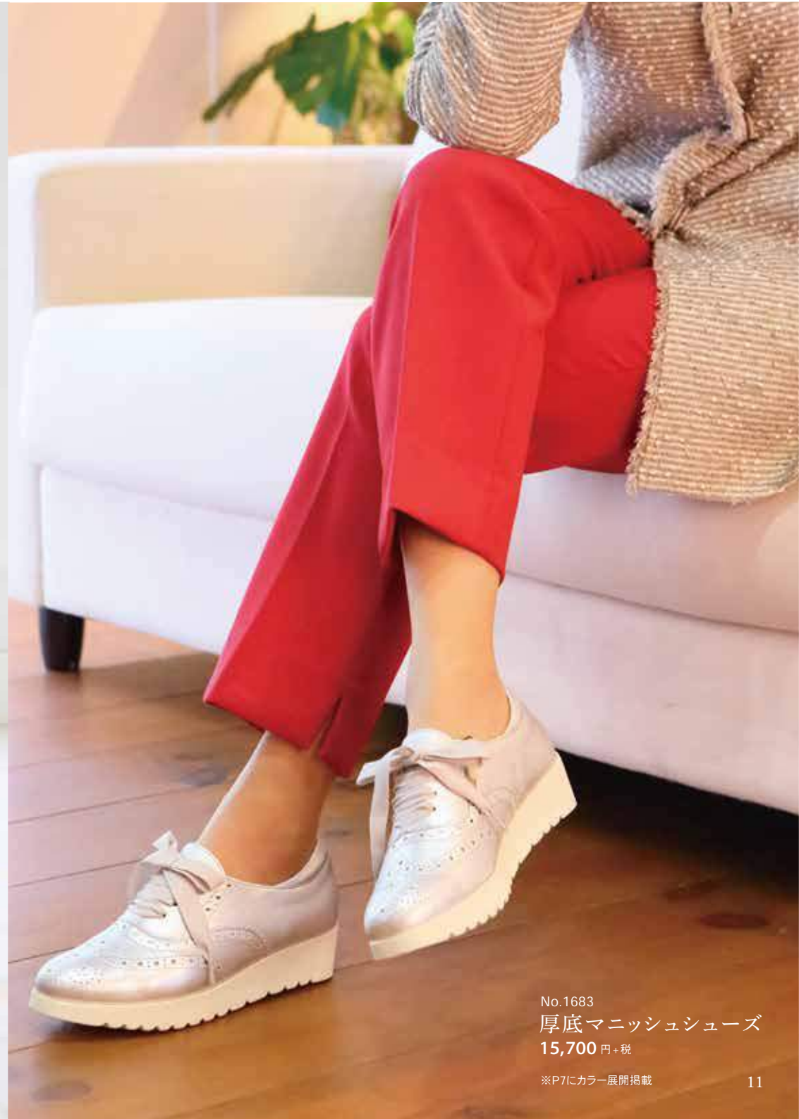
No.1683 厚底マニッシュシューズ 15,700 円+税