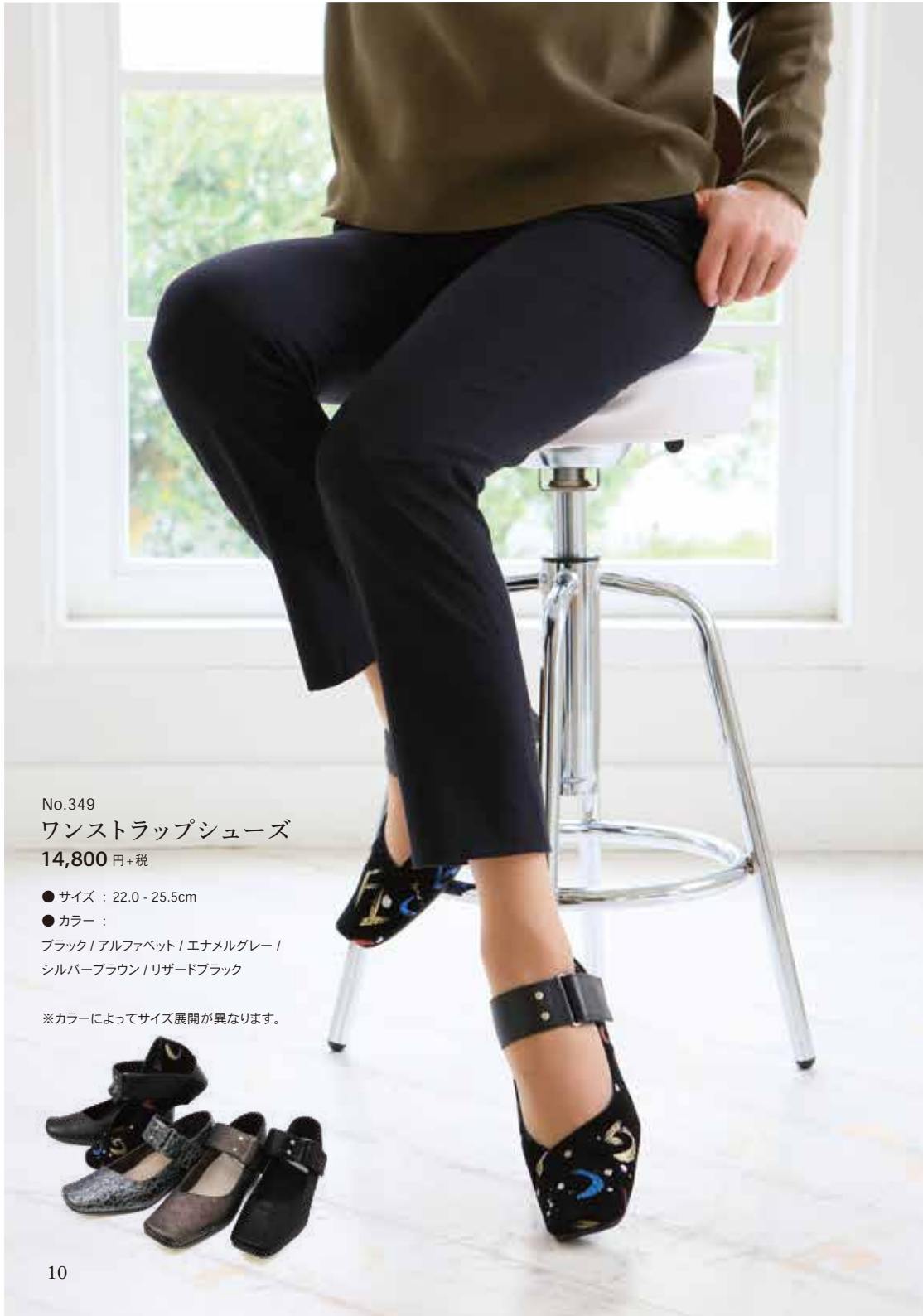
No.349 ワンストラップシューズ 14,800 円+税